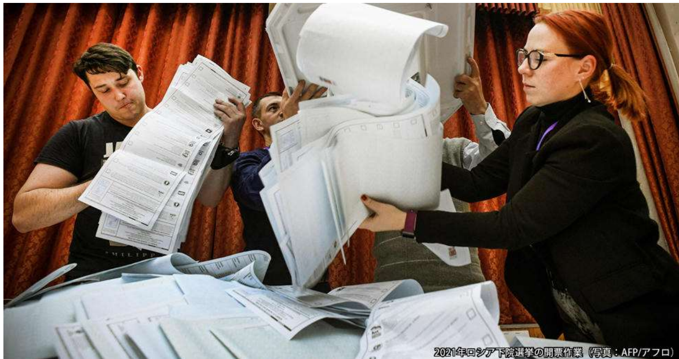
2021年ロシア下院選挙の開票作業