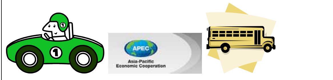
図 2-1 APEC ECO CAR PROJECT のトップページに盛り込むべき視覚要素

COP における温室効果ガス削減目標に資するが独自の目標として、TFAP (I および II) と同様の数値目標を設定する。たとえば APEC として「5 年間に 10% の EGS に関する明確な定義は存在していないが ( http://egs.apec.org/home の注記参照) 目標設定の例として、貿易促進を優先し、HS 貿易分類 (国際的に共通の 6 桁コード) をベースにしたデータベースを作成する。ガソリン自動車関連部品は車 1 台あたり 3 万点ほど、ハイブリッドカーや電気自動車の場合には 1 万点程度である。EGS において考慮されている (a) research and development, (b) supply, (c) trade and (d) demand のセグメントごとに必要な部品に関し、日本において既に 1990 年より取り組まれてきた「トップランナー制度」および「省エネラベリング制度」の手法を採用することにより、APEC メンバー同士の輸出において、貿易される EGS 関連財の種別を越えた経年的な省エネ努力が制度的に可能となる。 14